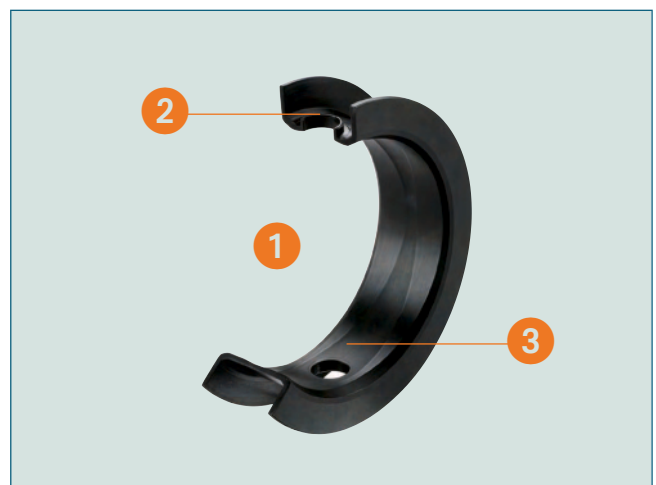
Bilde 2: Konduktiv PTFE - tetning.